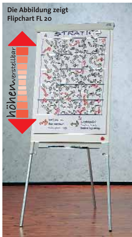
Die Abbildung zeigt Flipchart FL 20

Flipchart FL 20 mit Schnellklemme. Beschreibbare und magnetaftende Rückwand. Größe: 100 x 70 cm Mit Stiftablage, höhenverstellbar FL 20 115,00 €