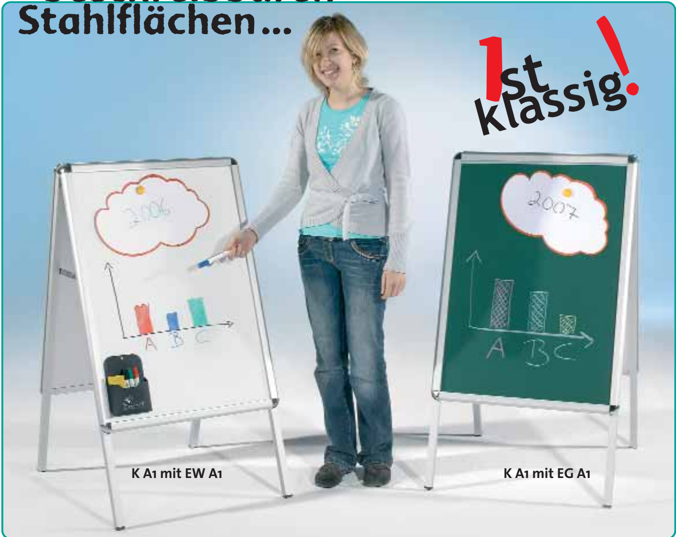
K A1 mit EW A1