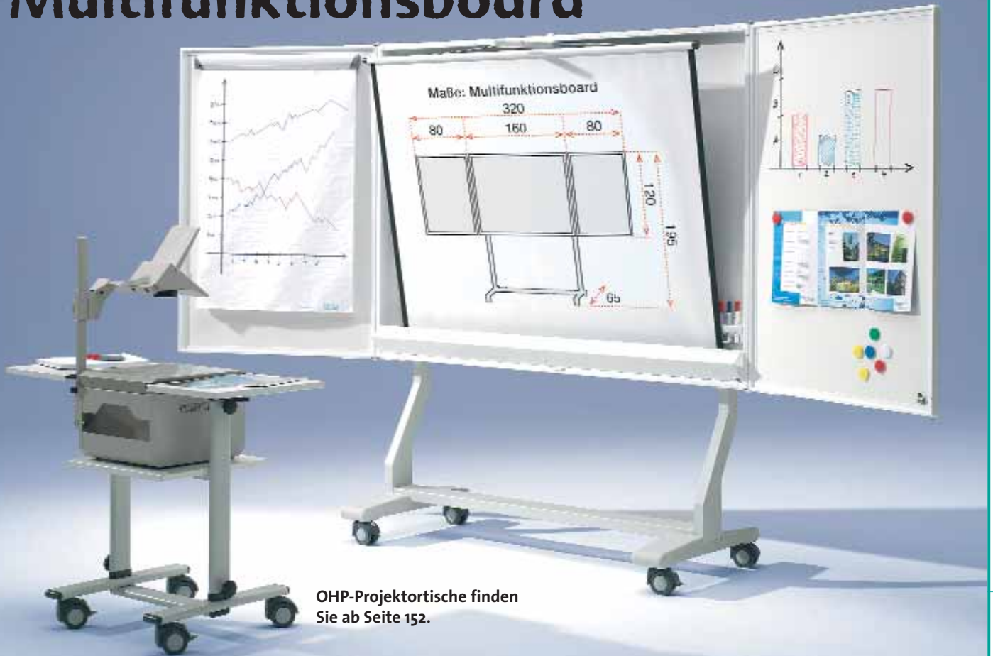
OHP-Projektortische finden Sie ab Seite 152.