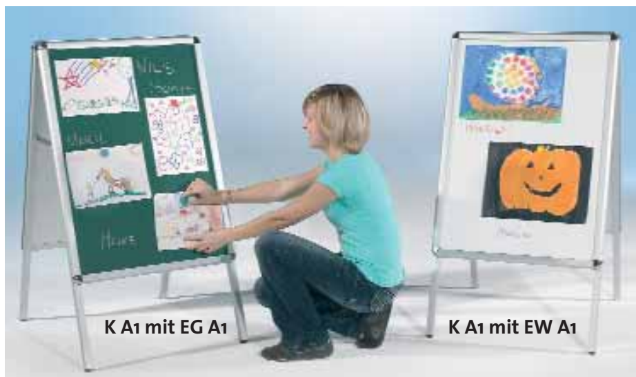
K A1 mit EG A1